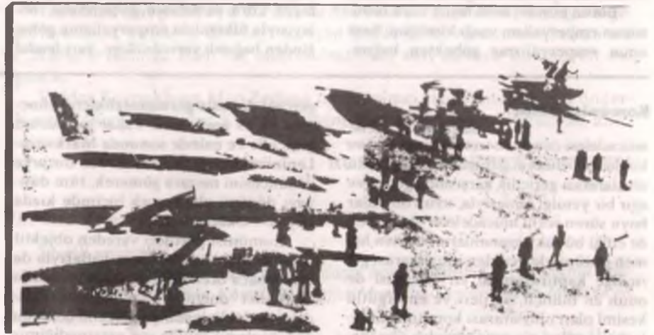
Nato'nun planlı tatbikatlarından Distand-Hammer-85 (Uzaktaki Çekiş)'ten bir görünüm

Lakin, çeşitli milliyetlerden Türkiye halkı, Faşist Türk devleti ve ordusunun bu emperyalizm uşağı ve halk düşmanı manevralarına kesinlikle mücadele etmeyecektir. Amerikan 6.Filosu askerlerini 1968'lerde dolmabahçe önlerinde denize döken anti-emperyalist bağımsızlık ruhunun en şanlı direniş örneklerini sergileyecek, ülkemiz toprakları üzerinde bir tek emperyalist üs, bir tek emperyalist tesis ve bir tek emperyalist asker kesinlikle bırakılmayacaktır. Komprador burjuvzi ve toprak ağası sınıflarına olduğu gibi, onların emperyalist efendilerine de, layık oldukları cevabı mutlaka verecektir.