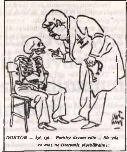
DOKTOR — İyl, İyl... Parhize devam edin... Bir yıla va'maz ne isterseniz iyebilirsiniz.

"Dolar her şeye egemen. Yalnız biz değil, tüm Avrupa doların pençesinde çırpınıyor. Dolar bir yükseliyor, Avrupa perişan oluyor. Biz yerimizden oynuyoruz. Dolar bizi oynatıyor. Bizim ekonomi doların egemenliğinde. Dolar bizim ekonominin 3'te