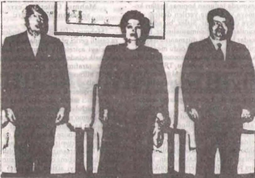
Faşist Özal, bu kez de Japon emperyalizminin ayağına kapanarak, Türkiye'yi pazarladı. Resimde Özal İmparator Hirohito'ya görünmüyor.

Gerçekten de, gerek gelmiş geçmiş tüm hakim sınıf sözcülerinin, gerek faşist cellat Evren'in, gerekse tescilli IMF'ci Özal palyaçosunun; "Büyük Türkiye", "küçük Amerika", "yeni Japonya" vs. demagojilerinin aslı astarı yoktur. Bütün bu demagogik sloganların amacı; ülkemizin emperyalizme göbeğinden bağımlı yarı-sömürge, yarı-feodal